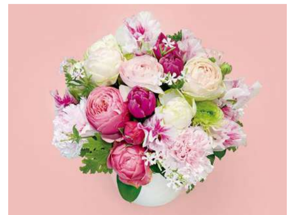
春の訪れを告げる花々を、優雅にまとめたアレンジメント。 愛妻の日、感謝の気持ちを美しく演出します。