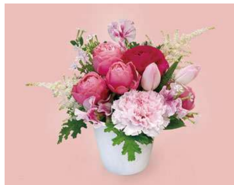
「スプリンググレース M」 6,600円(税込) サイズ | 長さ約20cm × 幅約20cm × 高さ約15cm