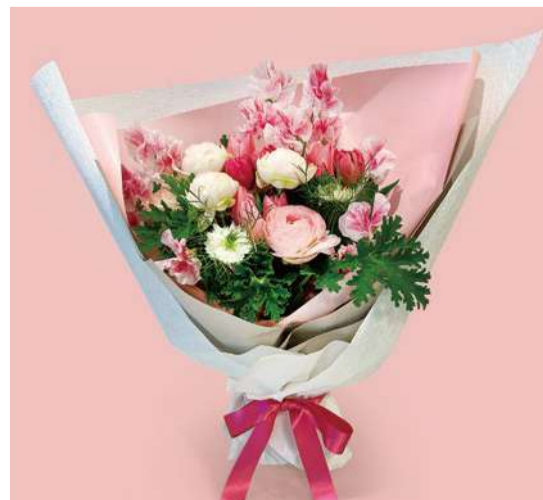
「スイートスプリング L」 11,000円(税込) サイズ | 長さ約40cm