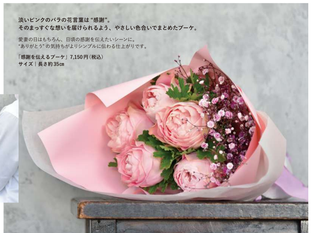
淡いピンクのバラの花言葉は「感謝」。 そのまっすぐな想いを届けられるよう、やさしい色合いでまとめたブーケ。