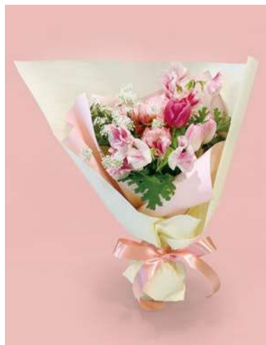
やさしい春の花々で、 感謝の気持ちをそっと届けるブーケ。 「スイートスプリング M」 4,400円(税込) サイズ | 長さ約35cm