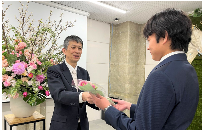
入社式で「希望」「常に前進」の花言葉をもつガーベラを手渡す様子

AlonAlon と協力し、当社が新たに雇用した社員も生産に関わることで、第一園芸の贈答用の花鉢の中で売上のトップを長年保ち続けている胡蝶蘭の一部を、生産・仕入れから販売まで一貫して行うことができるようになりました。また胡蝶蘭の取引・スタッフの雇用だけではなく、人材の交流も視野に入れています。農園で働く第一園芸スタッフの同期の新入社員や胡蝶蘭の関係部署の担当者が、AlonAlon オーキッドガーデンに出向き見学や現地確認を行ったり、AlonAlon で働く第一園芸スタッフが当社のイベントに参加したりと、双方向で交流することを目指します。AlonAlon のみなさんに、第一園芸の仲間であると実感いただくことや、胡蝶蘭作りに真摯に向き合う AlonAlon スタッフの姿が第一園芸社員へのポジティブな刺激となることを期待しています。