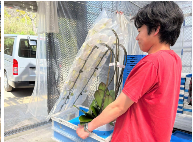
第一園芸への出荷を行う当社スタッフ