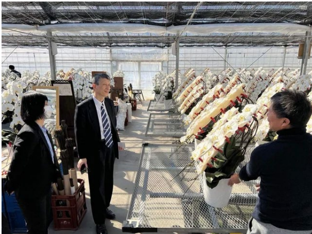
第一園芸 社長・人事部長による農園視察の様子