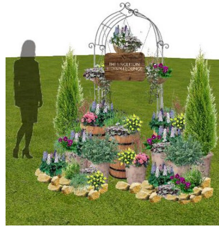
エントランス装飾イメージ