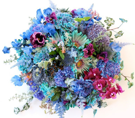
ゲストテーブルアレンジメント 参考価格:33,000円