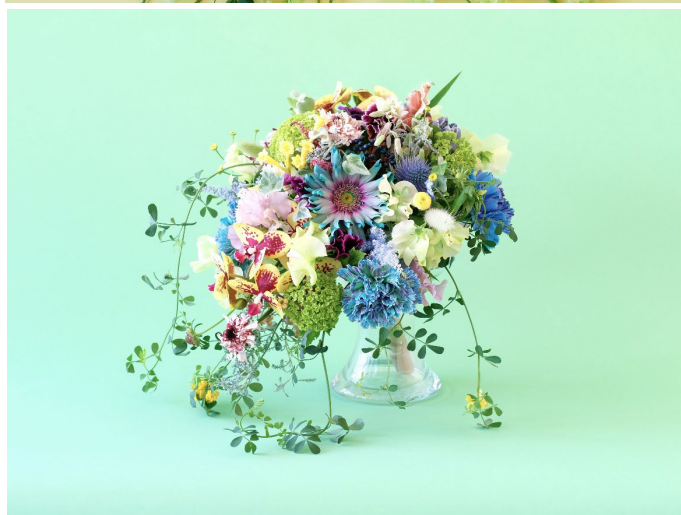
ブーケ 参考価格：49,500 円