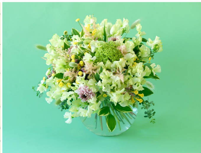
ゲストテーブルアレンジメント 参考価格：27,500 円