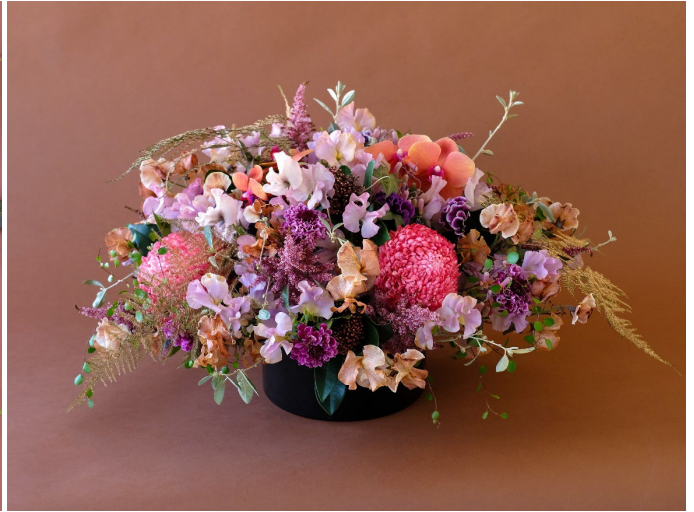
ゲストテーブルアレンジメント 参考価格:33,000円

映画・演劇の街として煌びやかなイメージを持つ日比谷を自然の植物には存在しない特別な色「ゴールド」に染色したアスパラガスで表現。ブラウンやパープルなど濃厚な色合わせで、ラグジュアリーでリュクスな印象に。