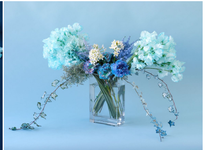
ゲストテーブルアレンジメント 参考価格:22,000円