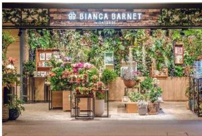
館内地下1階のフラワーショップ「BIANCA BARNET BY OASEEDS」