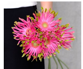
(右) 流通している花