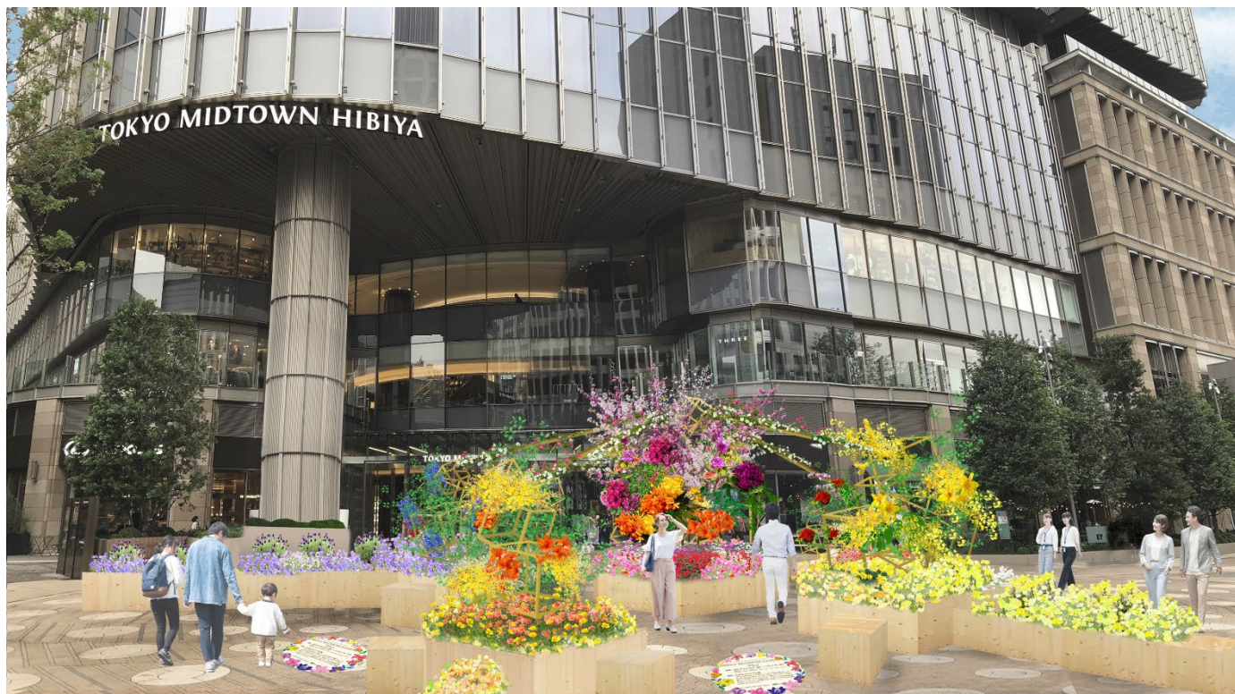
HIBIYA BLOSSOM GARDEN イメージ