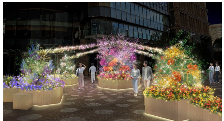
夜の様子 イメージ