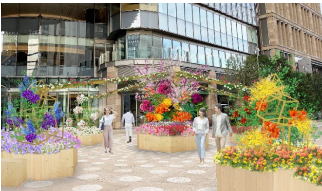
昼の様子 イメージ

都心の屋外に突如現れる、春の訪れと新しい日常の始まりを楽しむこの空間は、昼と夜でドラマティックに変化します。HIBIYA BLOSSOM GARDENのソーシャルディスタンスが保たれたベンチに座り、昼は春の日差しと花のエネルギーを、夜は幻想的な光のイルミネーションと特別演出で癒されてみませんか。