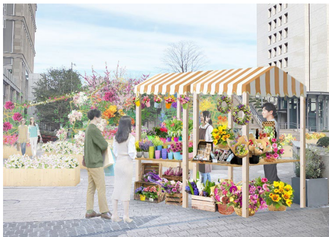
HIBIYA BLOSSOM FLOWER WAGON イメージ

館内地下1階のフラワーショップ「BIANCA BARNET BY OASEEDS (ビアンカバーネット バイ オアシーズ)」が、東京ミッドタウン日比谷1階の日比谷ステップ広場「HIBIYA BLOSSOM FLOWER WAGON」に出店。季節のおすすめの花はもちろん、本物の植物を素材に使ったボタニカルアクセサリーや、ピアス、イヤリング、リース、ブーケなど、BIANCA BARNET オリジナル商品を取り揃えます。おうち時間を彩る、色とりどりの春の花を揃えてお迎えしますのであわせてお楽しみください。