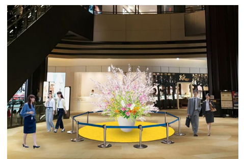
アトリウム装飾 イメージ