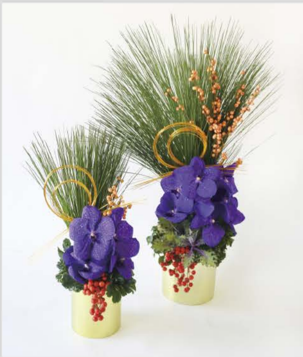
¥27,500(参考価格) ※セット価格