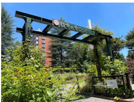
色彩のローズガーデン

5月の拡張リニューアルにより、より広々とした、密になりにくい空間となりました。夏の暑さに負けない元気な植物たちをぜひご覧ください。