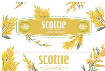
イエロー：ミモザ 花言葉：優雅、友情