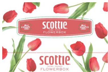
レッド：チューリップ 花言葉：愛の告白、真実の愛