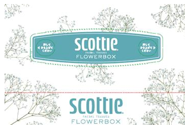
ブルー：かすみ草 花言葉：清らか、感謝

■旧デザインから引き続き花のデザインを第一園芸が担当 長らく親しまれた旧デザインが明るくカラフルな花々だったのに対し、新デザインでは、より現代のライフスタイルになじむ親近感のある植物をラインナップ。花屋ならではの視点を活かし、植物のいきいきとした美しい姿を表現することにこだわりました。