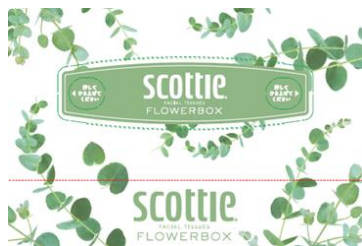
グリーン：ユーカリ 花言葉：新生、思い出