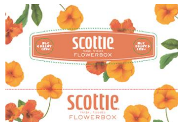
オレンジ：パンジー 花言葉：天真爛漫、楽しい