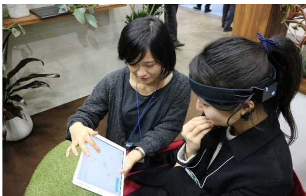
脳波の測定結果をその場でチェック

特に大きかったのは「リラックス度」の変化。体験者の多くから、グリーン空間に身を置くことで気持ちが落ち着き、リラックスできるという結果が得られました。