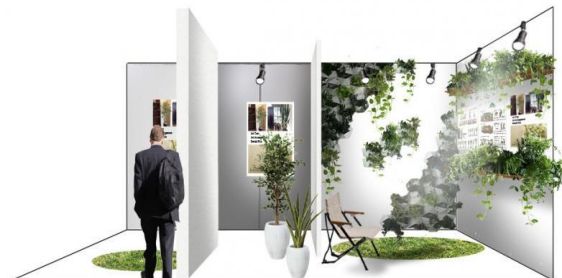
体感ブースイメージ

空間ごとに測定した脳波を「リラックス度」「好き度」「興味度」に分類し推移をデータ化。結果をその場でチェックし、空間の違いによる脳波の変化を体感することができます。