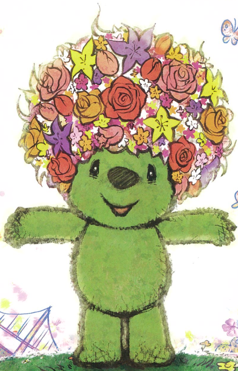
第33回全国都市緑化よこはまフェア シンボルキャラクター「ガーデンベア」