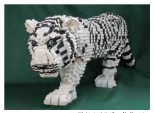
※写真は三井氏の作品です。

PROFILE プロフィール 1987年4月生まれ。兵庫県明石市出身。日本人初のレゴ®認定プロビルダー。灘高等学校3年生の秋にテレビ番組「レゴ®ブロック王選手権」に出場、デンマークで開催される決勝に進出し、準優勝を果たす。東京大学入学後に「東大レゴ®部」を創設し、安田講堂や赤門など東京大学の建造物を制作。2010年にはレゴ®ブロックを使った社会貢献として東京大学総長賞を受賞。2011年7月には世界で13人目、日本人として初のレゴ®認定プロビルダーに選ばれた。2015年4月に三井ブリックススタジオ株式会社を創業。依頼作品の制作の他に、様々なイベントなどにも多数出演する。