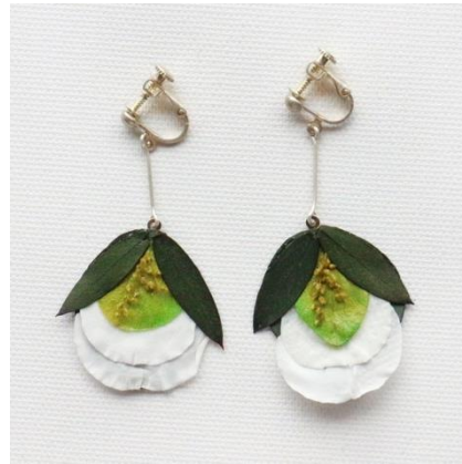
ROSE (イヤリング) (白バラ、ユーカリ、アジサイ、シャワーグラス)