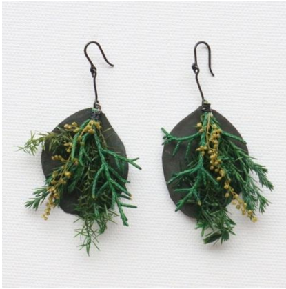
ITOSUGI (ピアス、イヤリング) (スギ、コニファー、シャワーグラス、ユーカリ)