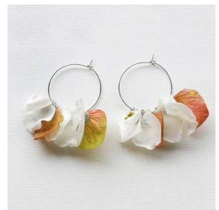
ROSE (ピアス) (白バラ、アジサイ、シャワーグラス)