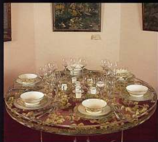
【作品写真】 上：透き通るアクリルのテーブル 右上：キュウビズムのテーブル 右下：ピーコック(孔雀の羽)のテーブル