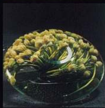
写真: DANIEL OST in SHIBUYA SEIBU 2007 花の建築家ダニエル・オスト「華やかなる花の小宇宙」展 作品集より